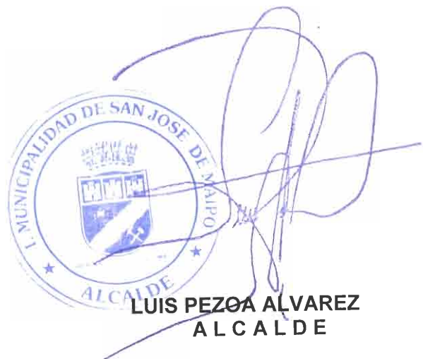
LUIS PEZOÁ ALVAREZ ALCALDE

DISTRIBUCIÓN: DEPTO. FINANZAS; CONTROL INTERNO; ADMINISTRACIÓN; ARCHIVO.-